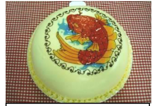
2008 部門賞 「鯉ケーキ」田邊さん

ウィットに富んだキャラクター(著作権にふれないものに限ります。ただしハビークラブオリジナルキャラクター「ハビークん」は自由に商品化できます。)をイメージしたアニメーション風手づくり料理、菓子。素材は問いません。営業として特別メニュー(趣旨の解説付き)に加え、実際に販売しているものが望まれる。販売条件期間8月中。