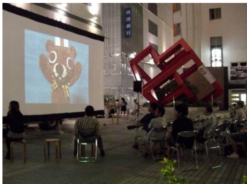
2008アリスGでアニメナイト NPOセトラひろしま共催

ご提供いただいた個人情報につき ましては、作品の選考や結果につい てのご連絡や、Haby クラブからの 各種お知らせのみに使用いたします。 応募者ご本人の許可なく「ひろし ま街じゅうアニメーションで賞」で の募集・表彰事業に関する業務以外 には使用いたしません。また、応募 者ご本人の許可なく審査員・関係者 以外の第三者に個人情報を開示する ことはありません。