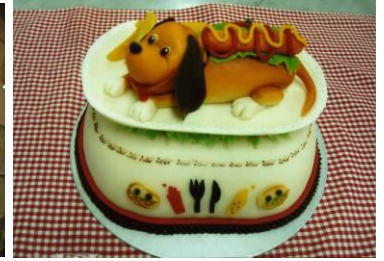
2008 アイディア賞 「ホットドック」高橋さん 「紙芝居 河童伝説」亀井さん