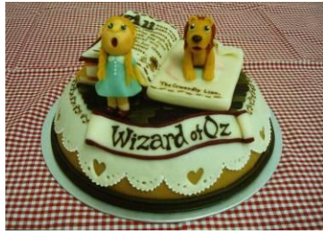
2008 技術特別賞 「オズの魔法使い」西川さん 「装甲ロボット兵 ラムダ改」赤木さん