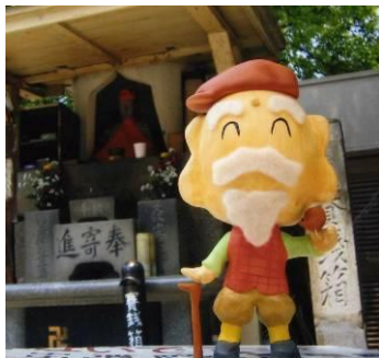
2008 フィギュア部門賞 「じぞ爺」 長島さん他