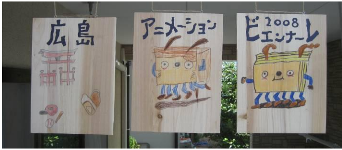
2008 手づくりバナー部門賞 中山さんほか