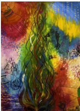
2008 ポスター部門賞 「おさんぎつね」 吉川さん

オリジナルデザインの手づくりのバナー、創作ポスター、手づくり人形。サイズ、形状は問いません。旗や鯉のぼり、テルテル坊主のように、通りから見える建築物の玄関先、軒先、庭先、自動車などに実際に掲げているもの。掲示条件期間8月中。